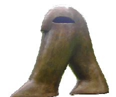
Eurasische Figur (weiblich)