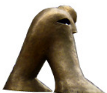
Eurasische Figur (männlich)